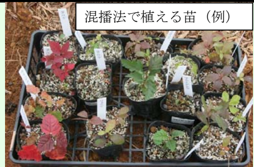
近くの山でタネを集め、1～2 年育てたもの。10cm くらいの大きさに育ててしまう。

混播法が開発された北海道では、植栽から 10 年以上が経過しました。植栽地ではシラカンバなどの生長の早い樹種による林が成立しつつあり、よく伸びた枝は隣のユニットの木々と接触するまでになりました。林の中では、将来の林の主役となるミズナラなどが着実に成長し、シラカンバに取って代わる日を待っています。