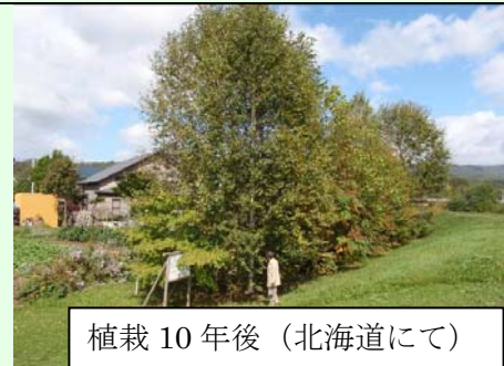
シラカンバは 10m を越え、その下では将来の主役となるミズナラが育っている。