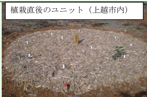
苗が小さいので、緑は目立たない。