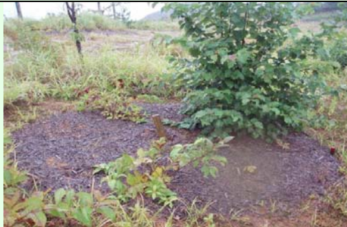
生長の早い木はもう 2m 近い。