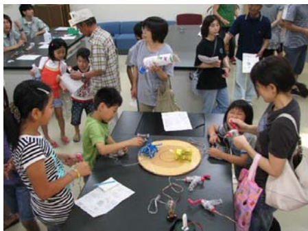
手回し発電機を使った遊び

当センターでは、実験・遊びを通じて環境や地球温暖化を知ることをお願いとして3種類の工作・実験を行い、子供を中心に300組以上の方々から参加して頂きました。