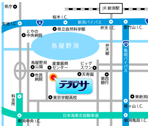
新潟会場【新潟テルサ】