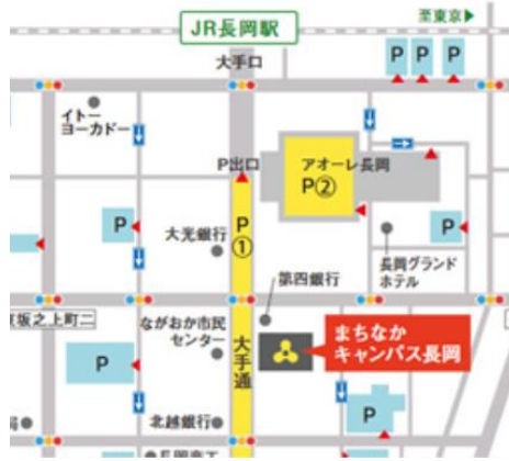
長岡会場【まちなかキャンパス】