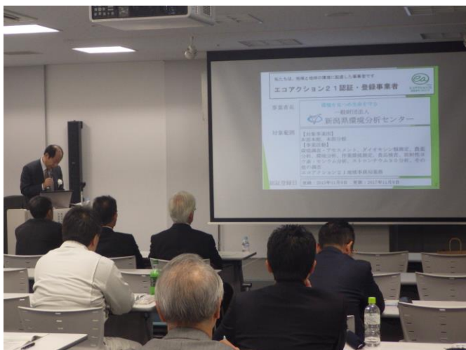
2017年版Q&A 地域事務局上越 梅林