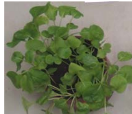
対照肥料試験区 (供試肥料と原料等が類似している普通肥料)