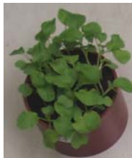
標準区 (窒素、りん酸、加里 それぞれ 25mg 相当添加)